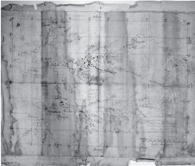
Figura 3. Mapa original atribuido a Garriga (1715), ALP. Digitalización: Laboratorio de Digitalización del ALP, 2023 26

En el “Catálogo de los documentos concernientes a la historia geográfica de Bolivia, reunidos en las investigaciones practicadas en diferentes Archivos, y remitidos al Ministerio de Relaciones Exteriores”, entre 1886 y 1889, por Manuel Vicente Ballivián en el marco de la Comisión Especial de Límites, hay un apartado de documentos sobre Moxos, Chiquitos y Santa Cruz de la Sierra, en el que