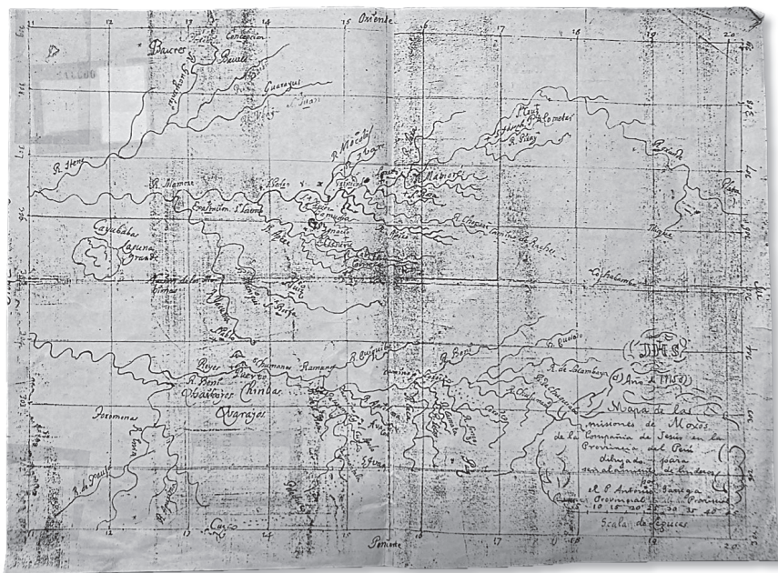
Figura 1. Focotopia del mapa, MUSEF.

al MUSEF. Al día siguiente me presenté en el lugar para verlo con mis propios ojos.